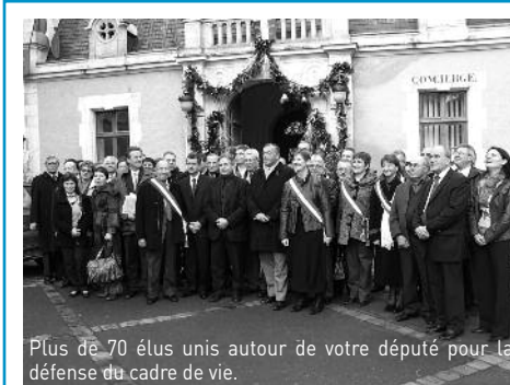
Plus de 70 élus unis autour de votre député pour la défense du cadre de vie.